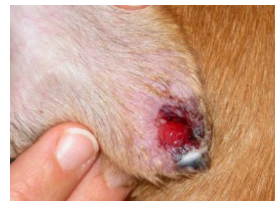
Leishmaniose-bedingte Hautveränderung an Hundehohr