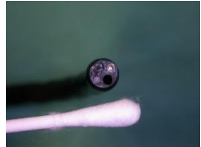
Endoskopspitze im Grössenvergleich mit einem Wattestäbchen

Wir verfügen über ein modernes human-medizinisches System (Olympus®) bestehend aus zwei flexiblen Endoskopen, begleitet von zwei starren Endoskopen der Firma Storz® für die Untersuchungen am Harnapparat. Unsere Dermatologen führen sehr häufig eine endoskopische Ohruntersuchung (Videootoskopie) durch.